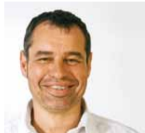
Jürgen Rössler Bodenbeschichtung und Betonsanierung @betec-beschichtung.de