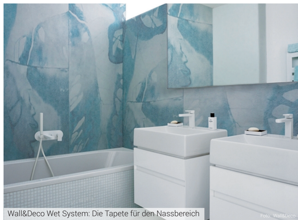
Wall&Deco Wet System: Die Tapete für den Nassbereich

Müssen Bäder immer gefliest sein? Wir meinen nein, denn mit den fugenlosen Beschichtungssystemen von Leibbrand geben wir Ihrem Bad ein völlig neues Gesicht. Mit verschiedenen Oberflächen, Strukturen, abstrakten oder bildhaften Motiven verwandeln wir Ihr Bad in ein einzigartiges Erlebnis.