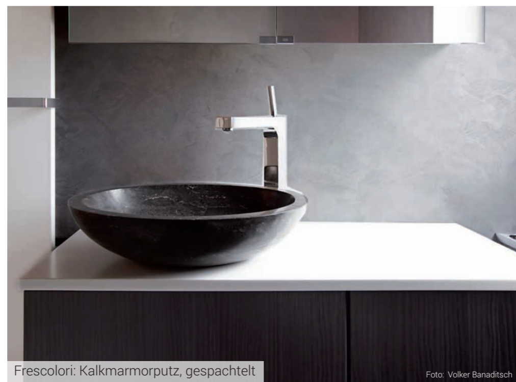
Frescolori: Kalkmarmorputz, gespachtelt